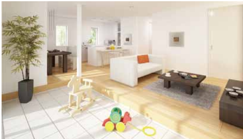
LDKにつながる土間スペースは使い方がいろいろ