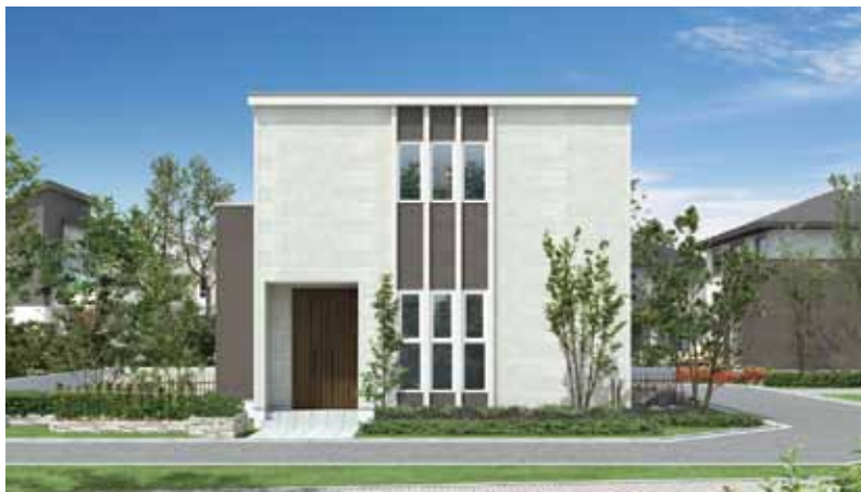
洋風モダンな外観をはじめ、自由な発想で土間をお楽しみいただけます