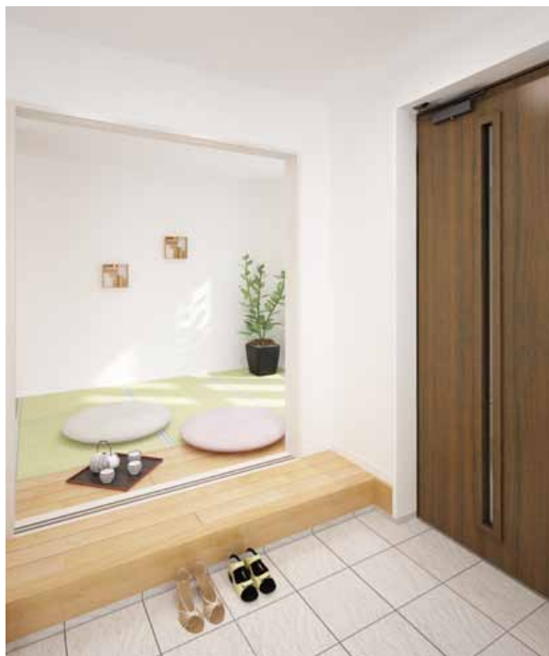
玄関から直接つながる和室はちょっとした来客にも便利