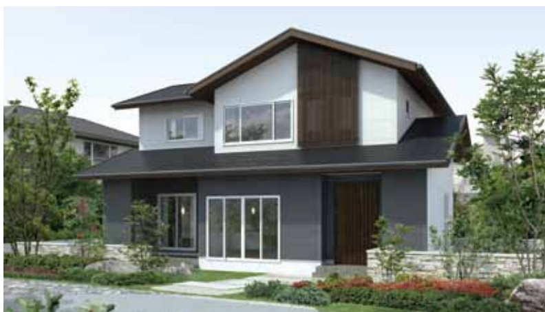
和と現代建築を上手に組み合わせた落ち着いたある行まい