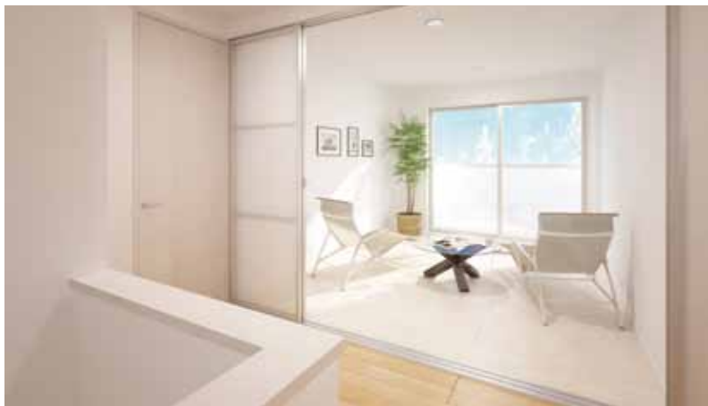
外とのつながりと降り注ぐ光が印象的なサンルーム