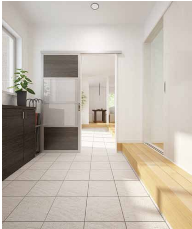
玄関から和室、LDKへとつながりながら伸びる、あらためて見直す「土間」空間