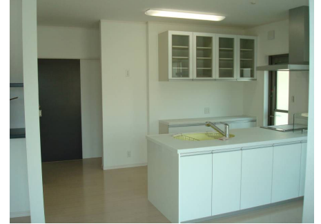
水廻りの動線は一直線 家事がとってもはかどります