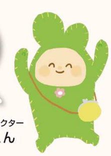
イメージキャラクター ユーボくん