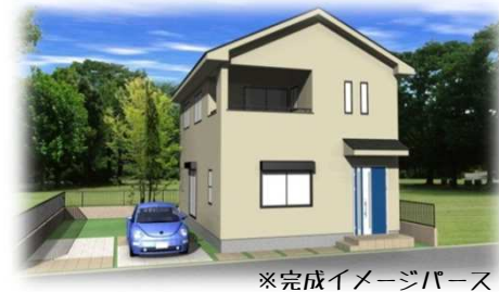
※完成イメージパース